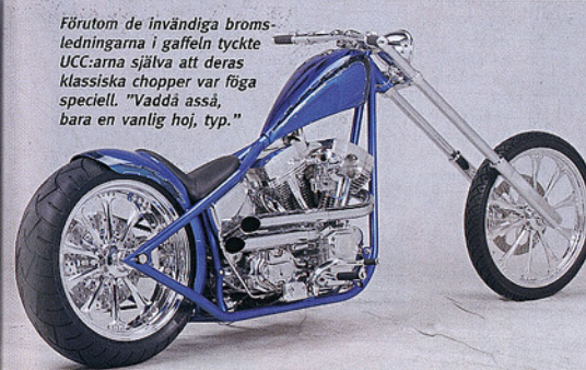
Förutom de invändiga bromsledningarna i gaffeln tyckte UCC:arna själva att deras klassiska chopper var föga speciell. "Vaddå asså, bara en vanlig hoy, typ."