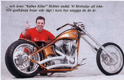
... och även "Kalles Killer" förblev osåld. Vi förmodar att icke-TUV-godkända hojar står lågt i kurs hur snygga de än är.