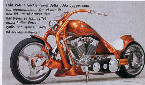
Från VMP i Tjeckien kom detta udda bygge, som tog niondeplatsen. Om vi inte är helt fel ute så brukar den här typen av framgaffel oftast kallas Earls-gaffel och syns till 99% på sidvagnsekipage.