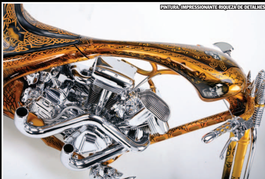
PINTURA: IMPRESSIONANTE RIQUEZA DE DETALHES