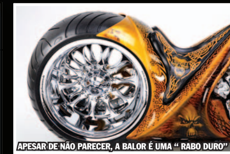
APESAR DE NÃO PARECER, A BALOR É UMA "RABO DURO"