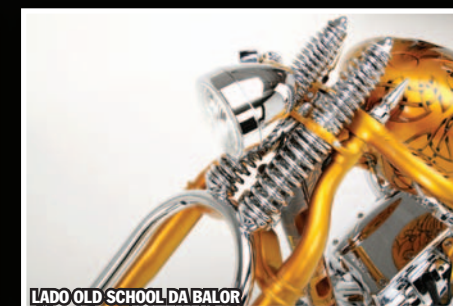
LADO OLD SCHOOL DA BALOR