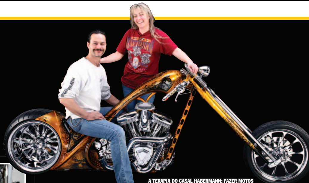
A TERAPIA DO CASAL HABERMANN: FAZER MOTOS

faz um caminho diferente do usual, dando a volta pela frente da moto e saindo paralelamente a cano que vem do cilindro dianteiro. Considerado por muitos como apenas mais alguns detalhes, as manoplas em questão fogem a essa simples denominação: basta que você repare na fotos e entenderá facilmente a que me refiro. Aposto que muitos perguntaram lá atrás, quando falamos das rodas: "E o pneuzão, qual será sua medida?" A resposta é 330! O suficiente para dizermos que tudo nela supera o já visto!