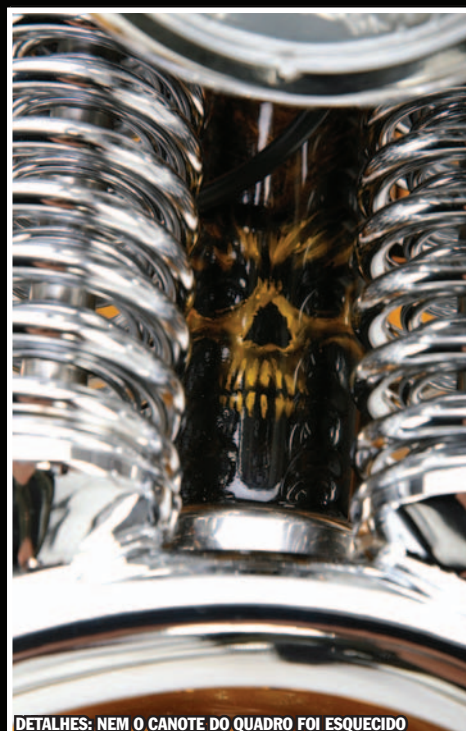
DETALHES: NEM O CANOTE DO QUADRO FOI ESQUECIDO