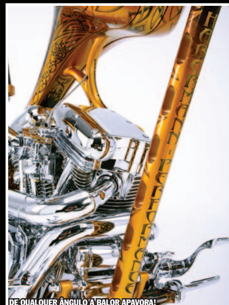
DE QUALQUER ÂNGULO A BALOR APAVORA!