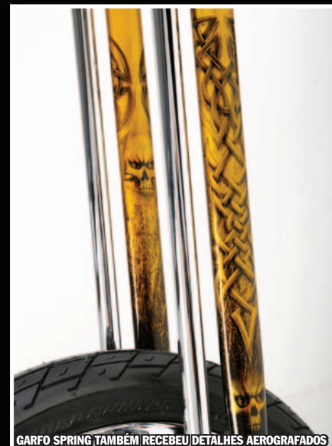
GARFO SPRING TAMBÉM RECEBEU DETALHES AEROGRAFADOS