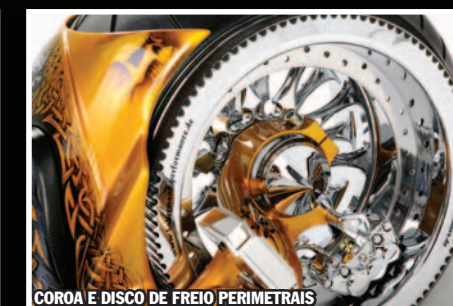
COROA E DISCO DE FREIO PERIMETRAIS