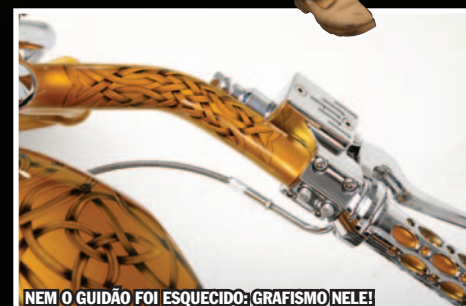
NEM O GUIDÃO FOI ESQUECIDO: GRAFISMO NELE!