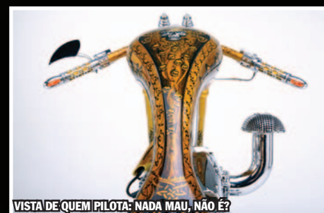
VISTA DE QUEM PILOTA: NADA MAU, NÃO É?