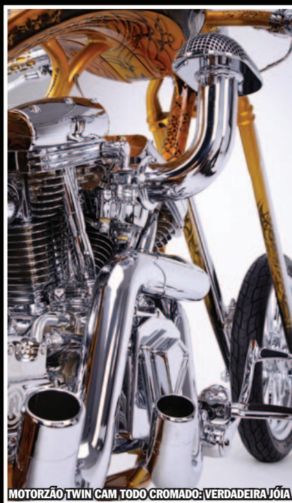
MOTORIZÃO TWIN CAM TODO CROMADO: VERDADEIRA JÓIA